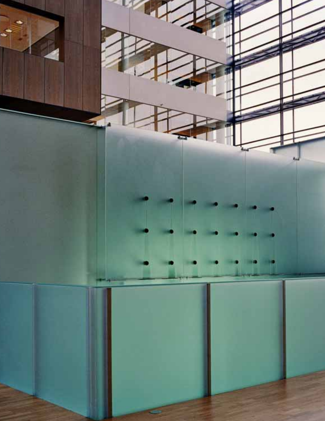
Anita Jørgensen: Sense and sensibility , 2002